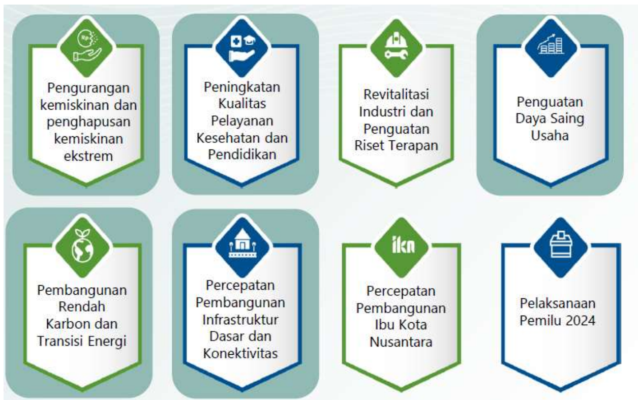
Gambar 3.1 Arah Kebijakan RKP Tahun 2024

Pada Tahun 2024, Tema Pembangunan Nasional yang ditetapkan dalam RKP Tahun 2024 adalah "Mempercepat Transformasi Ekonomi yang Inklusif dan Berkelanjutan" dengan 8 arah kebijakan sebagai berikut: